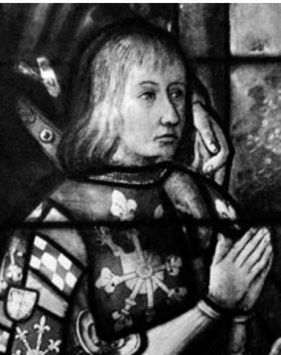
Filips van Kleef (1456-1528) op een glasraam in de Sint-Walburgiskerk te Bergen (Henegouwen, België)