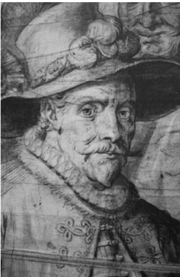
Willem van Nassau, prins van Oranje (1533-1584)