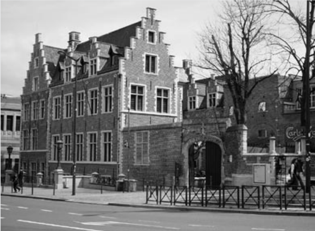
Filips van Kleef en Willem van Oranje, 'buren' op de Coudenberg te Brussel: boven het paleis van Ravenstein en onder het enige restant van het paleis van Nassau (de Sint-Joriskapel)