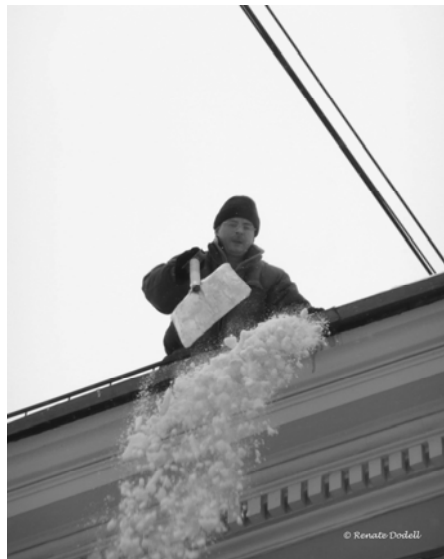
Sneeuwruimer op het dak (Sint-Petersburg, februari 2010)

De wandeltocht naar de universiteit was hierdoor ook elke dag een avontuur. Het feit dat we colleges volgden aan de European University had van tevoren een behoorlijke indruk op me gemaakt en ik had me dan ook voorgenomen om me extra in te zetten voor de vakken. Eenmaal in Petersburg kwam daar in eerste instantie echter weinig van terecht: mijn concentratievermogen leek wel samen met de temperatuur gedaald