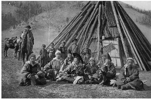
Een groep nomaden bij hun joert